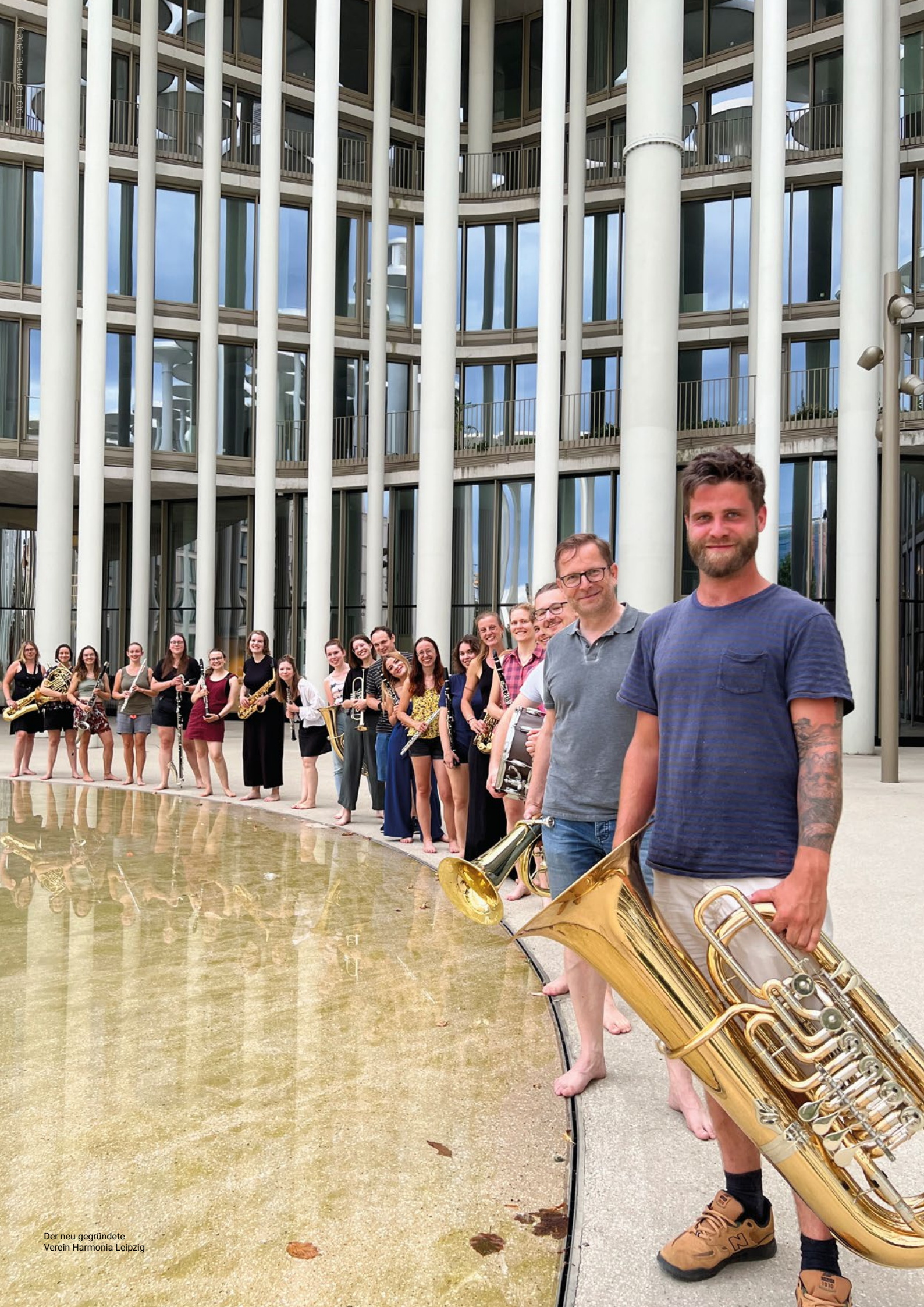
Der neu gegründete Verein Harmonia Leipzig