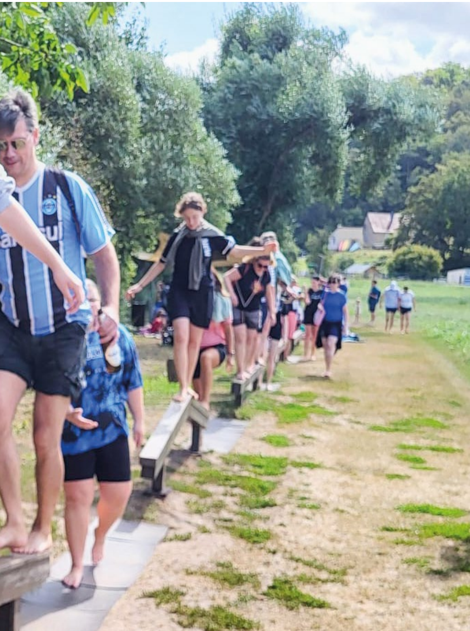
Wanderung auf dem Barfußpfad in Bad Sobernheim