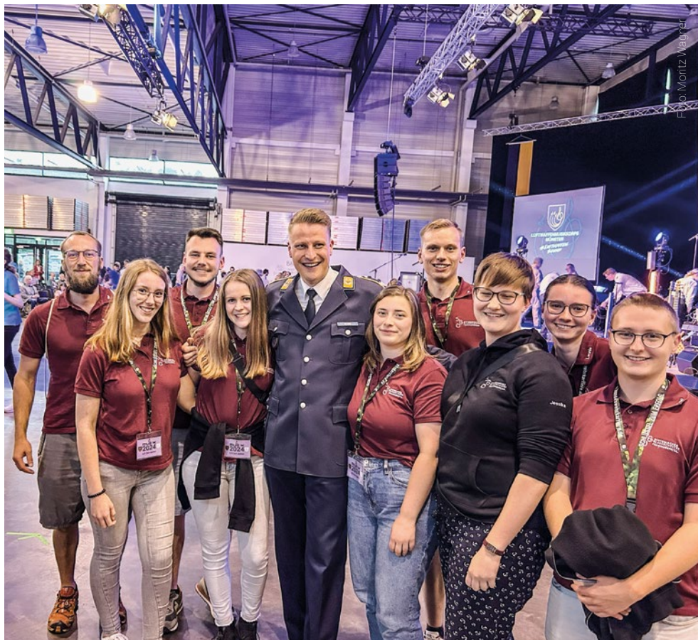
In Balingen beim Jugendmusikwettbewerb der Bundeswehr

Nachdem wir unsere Sachen aus der Turnhalle, in der wir mit ca. 200 weiteren Musikern geschlafen haben, wieder in den Bus verstaute hatten, ging es zur Siegerehrung.