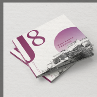
Vertraute Freunde Juvavum8