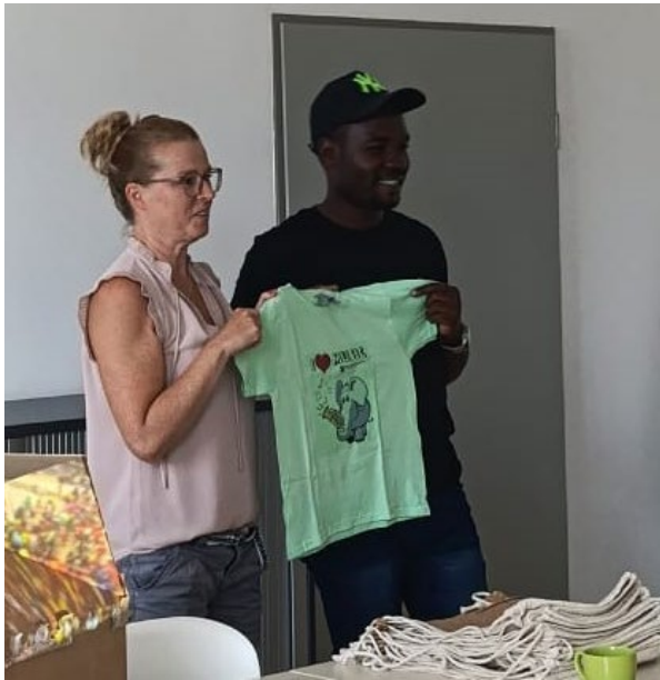
Übergabe von T-Shirts und Rucksäcken für die Delight Foundation