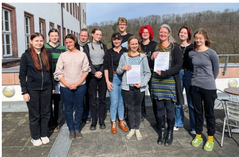
Teilnehmende Grund- und Aufbauseminar Juleica 2024