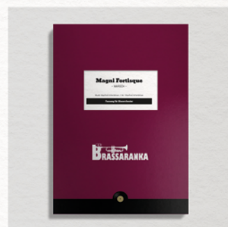
Magni Fortisque Brassaranka