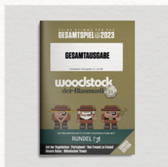
Gesamtspielheft 2023 Woodstock der Blasmusik