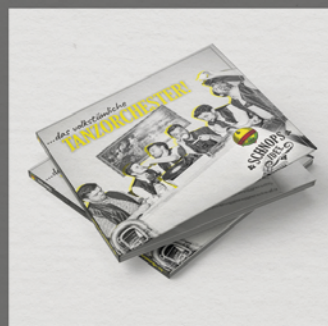
Das volkstümliche Tanzorchester Schnopsidee