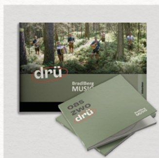
Drü (Special: CD & Notenheft) BradlBerg Musig