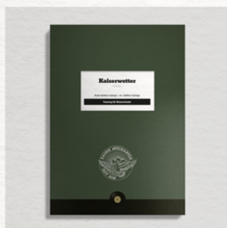
Kaiserwetter Kaiser Musikanten