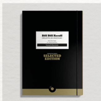
Böll Böll Kernöl Selected Edition

Noten für Blasorchester ab € 69,- Noten für Originalbesetzung ab € 39,- Notenhefte ab € 49,- CDs ab € 19,-