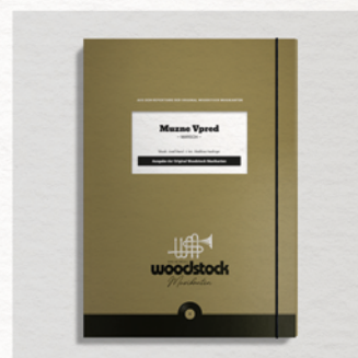
Muzne Vpred Orig. Woodstock Musikanten

Noten für Blasorchester ab € 69,- Noten für Originalbesetzung ab € 39,- Notenhefte ab € 49,- CDs ab € 19,-