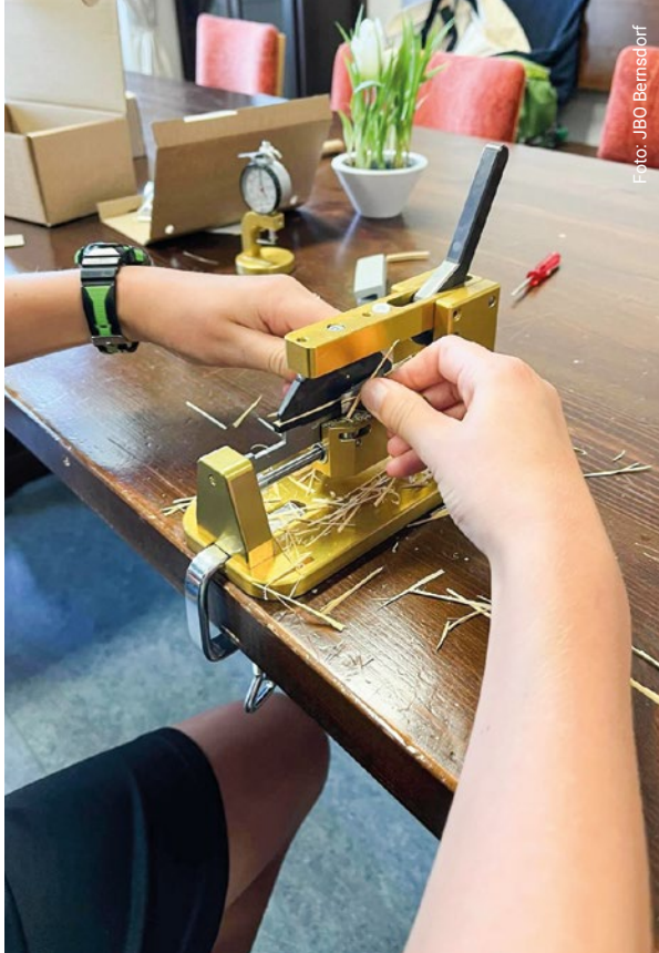
Herstellung von Fassons während des Workshops „Rohr- und Blattbau“