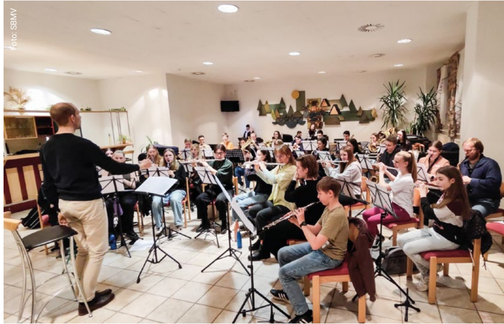
Orchesterspiel Stufe D2 und D3