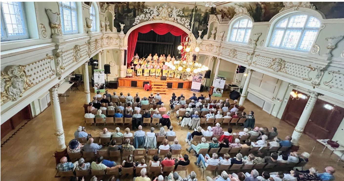
Konzert im Festsaal „Goldener Löwe“ in Hainichen