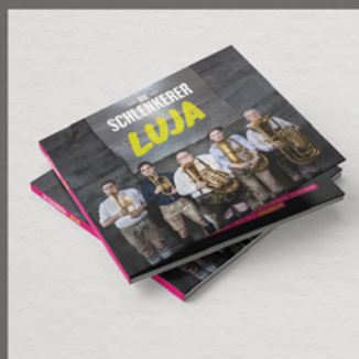
Luja Die Schlenkerer