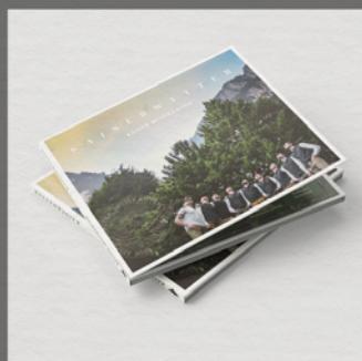
Kaiserwetter Kaiser Musikanten